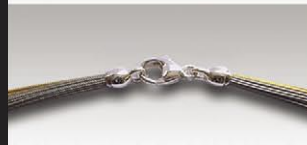
S 4738 ca.38-fach, davon 19 vergoldet, 11mm Silberkarabiner und Ösen