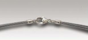
S 4718 s ca.18-fach, 11mm Silberkarabiner und Ösen