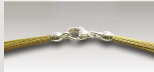
S 4738 v ca.38-fach, 11mm Silberkarabiner und Ösen