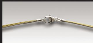
S 4709 ca.9-fach,davon 4 vergoldet, 11mm Silberkarabiner und Ösen