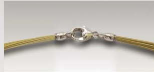
S 4718 v ca.18-fach, 11mm Silberkarabiner und Ösen