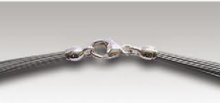
S 4738 s ca.38-fach, 11mm Silberkarabiner und Ösen