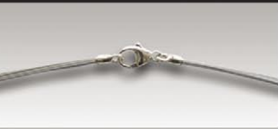
S 4709 s ca.9-fach, 11mm Silberkarabiner und Ösen