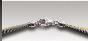
S 4752 ca.52-fach, davon 26 vergoldet, 11mm Silberkarabiner und Ösen