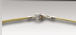
S 4709 v ca.9-fach, 11mm Silberkarabiner und Ösen