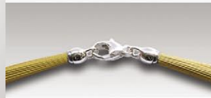
S 4752 v ca.52-fach, 11mm Silberkarabiner und Ösen