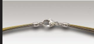
S 4718 ca.18-fach, davon 9 vergoldet, 11mm Silberkarabiner und Ösen