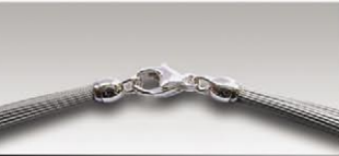
S 4752 s ca.52-fach, 11mm Silberkarabiner und Ösen